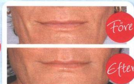
Med hjälp av hyaluronsyran Teosyal har slätat ut linjerna kring patientens mun.