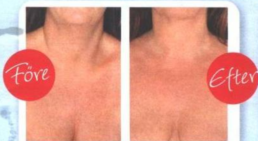
Hudföryngring på dekolletage med Vitale.

Från 2 000 kronor och uppåt beroende på hur mycket man behöver injicera.